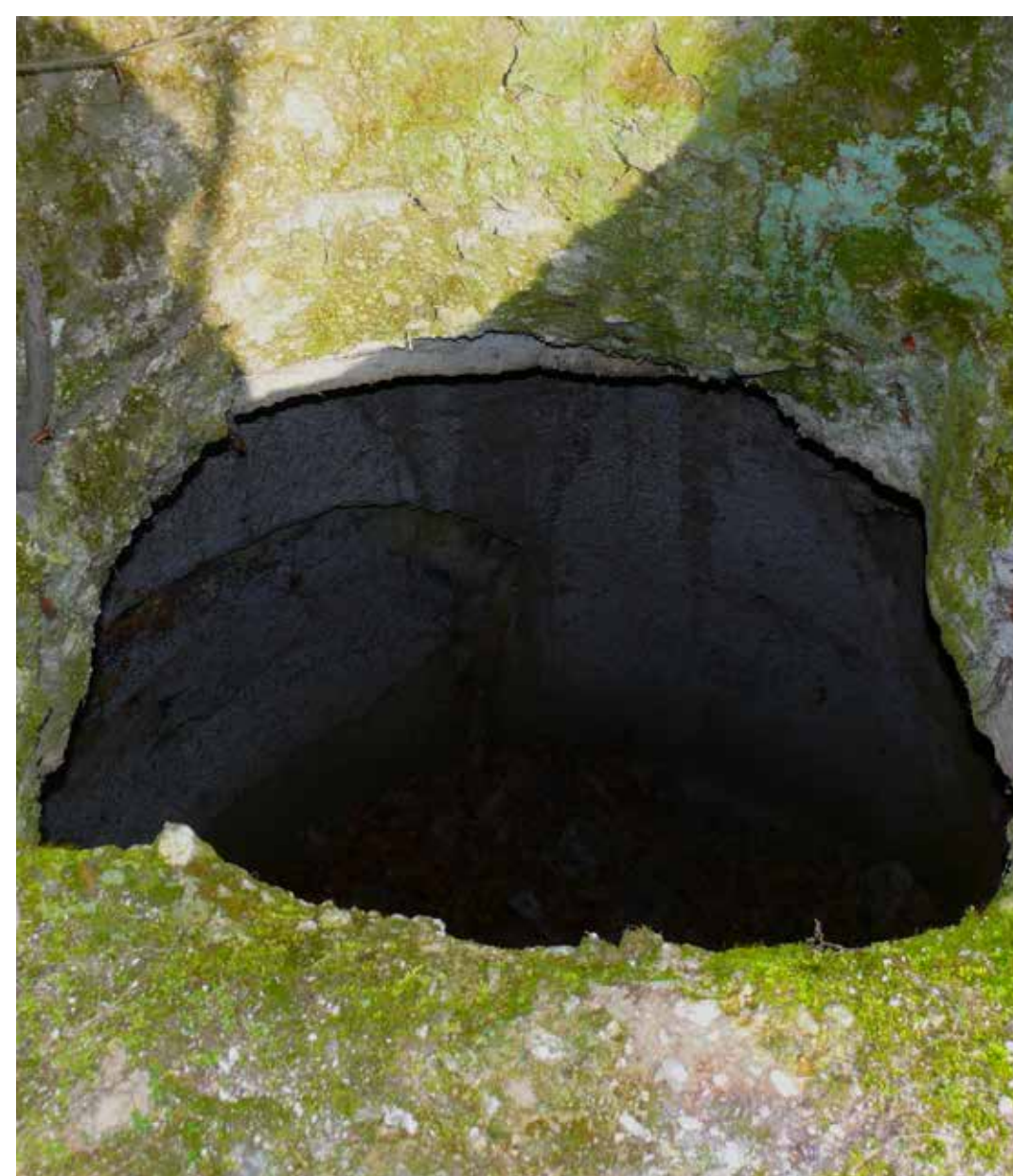
Gabonavermek a Vár-hegy oldalában

A vár alatt, a Várhegy oldalában 12 riolittufába vájt vermet találhatunk, melyek valaha gabona tárolására szolgáltak. A cserépváraljai gabonátároló vermek hazánk legnagyobb ilyen célra készült építményei. Sokáig úgy vélték, hogy védelmi célokra készültek, de a régészek kutatásai megállapították, hogy a XVI. században gabonátárolás céljára alakították ki. Eredetileg a Tardról beszállított árpát helyezték el a hegy oldalában sorakozó vermekbe. A gabonavermek ma műemléki oltalom alatt állnak.