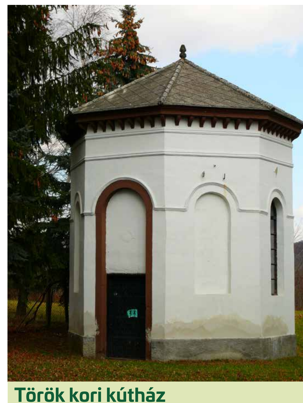
Török kori kútház

A kápolna szomszédságában áll az ugyancsak műemléki védelem alatt álló, nyolcszög alaprajzú, sátozott fedett kútház. Keletkezéséről nem sokat tudni, jellegéből adódóan a török korban készíthették. A romantikus jegyeket az 1860-as évekbeli felújítás során kapta. A mára elpusztult kastélyhoz tartozott. A kút átmérője meghaladja az egy métert, mélysége a vízszintig több mint 65 méter. Különböző mondák keringtek, miszerint a vízszint fölött egy alagút található, de ez nem bizonyított.