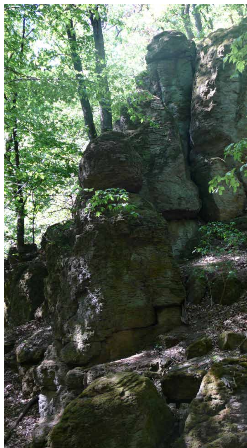
A Felső-szoros sziklatömbjei

A kápolna szomszédságában áll az ugyancsak műemléki védelem alatt álló, nyolcszög alaprajzú, sátozott fedett kútház. Keletkezéséről nem sokat tudni, jellegéből adódóan a török korban készíthették. A romantikus jegyeket az 1860-as évekbeli felújítás során kapta. A mára elpusztult kastélyhoz tartozott. A kút átmérője meghaladja az egy métert, mélysége a vízszintig több mint 65 méter. Különböző mondák keringtek, miszerint a vízszint fölött egy alagút található, de ez nem bizonyított.