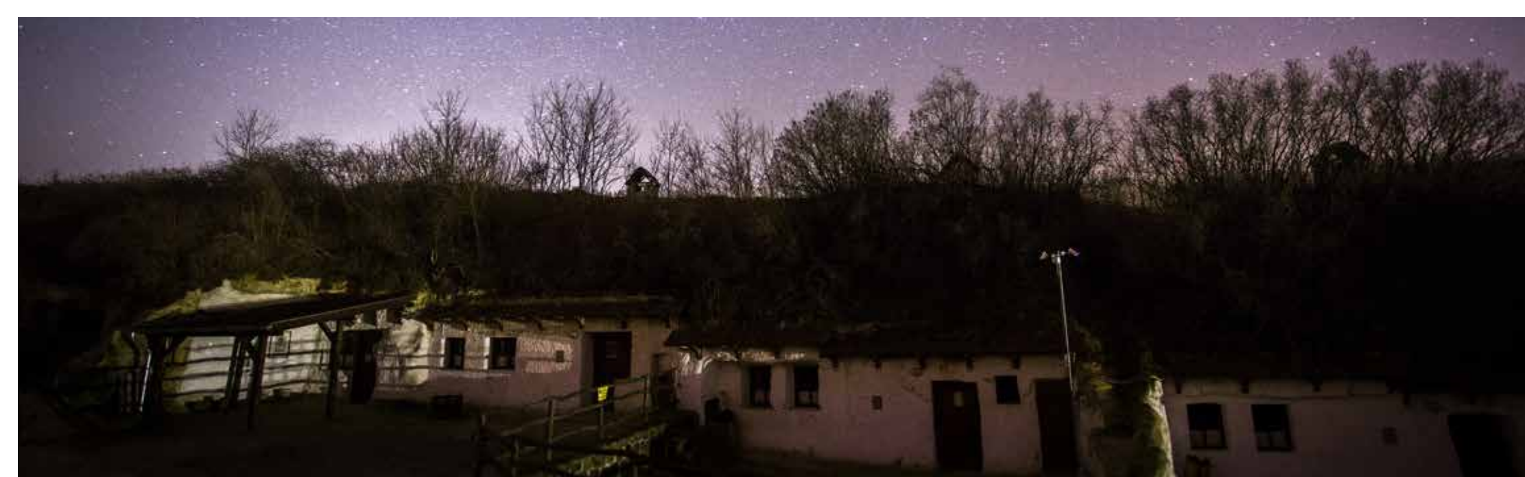
Sáfrány úti barlanglakások a csillagok alatt

Az Egerszalóktól délkeletre lévő Menyecske-hegyen még a 20. század első felében is legeltették a községi parasztok lovaikat, ezért Csikó-