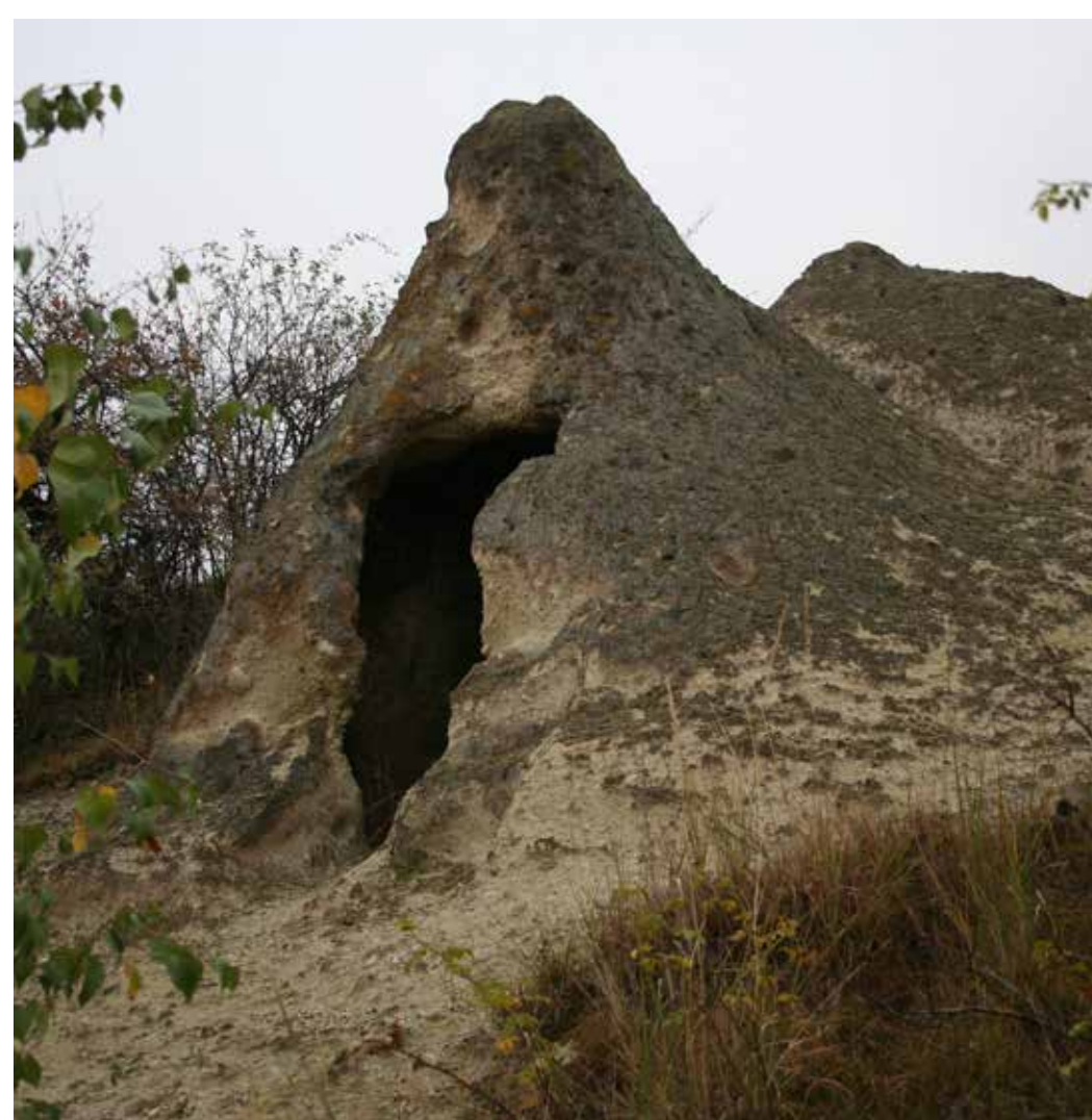
A Kőasszony faragott sziklakúpja

Az Egerszalóktól délkeletre lévő Menyecske-hegyen még a 20. század első felében is legeltették a községi parasztok lovaikat, ezért Csikó-