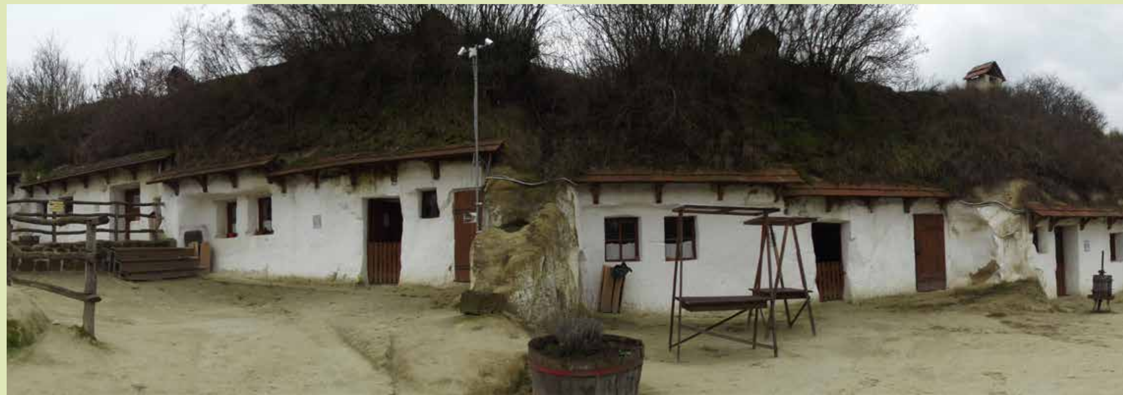
Helytörténeti gyűjtemény kapott helyet a Sáfrány úti barlanglakásokban

delkező jobbágy-paraszti réteg tulajdonában voltak. A barlangházakat a XIX. század elején nagyrészt szegények lakták, majd az 1980-as évek végére lakatlanná váltak, helyenként kamrának, borospincének még ma is használják. 2014-ben a Sáfrány utcai barlanglakásokban helytörténeti gyűjtemény került kialakításra. Részei a népi bemutató helyiségek, kézműves műhelyek, népi kézművességet oktató termek, borbemutató termek, és a domboldalban egy kis szabadtéri színpad.