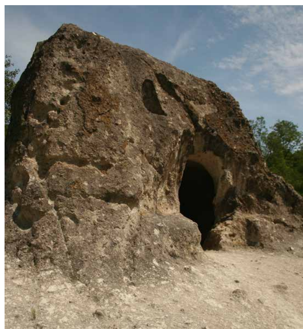
A Betyárbújó sziklatömbje

delelőnek, Csikójárasnak nevezték e gyepes területet. Az itt található egyik tufakúpba helyiséget faragtak kőfekhelyekkel, kőfülkékkel. A domb alatt húzódó völgy lehetett a csikók, a kőkunyhó pedig a csikósok éjjeli szállása, tehát a kőkunyhó a hajdani pásztorélet emlékének tekinthető. Ugyanakkor alkalmanként kitérő búvóhelye lehetett a törvény elől menekülő betyároknak is. A Betyárbújó elnevezéssel a környék majd mindegyik sziklahelyiségét illette a lakosság. A település déli részén, a demjéni út melletti pincesor felett, az Öreghegyen emelkedő tufatömbbe szintén egy bújó van vájva, amely bejárata felett egy kaptárfülke árválkodik, ezt nevezik Betyárbújó kaptárkőnek. A Menyecske-hegyen két sziklavonulaton pedig további 4 db kaptárfülke található.