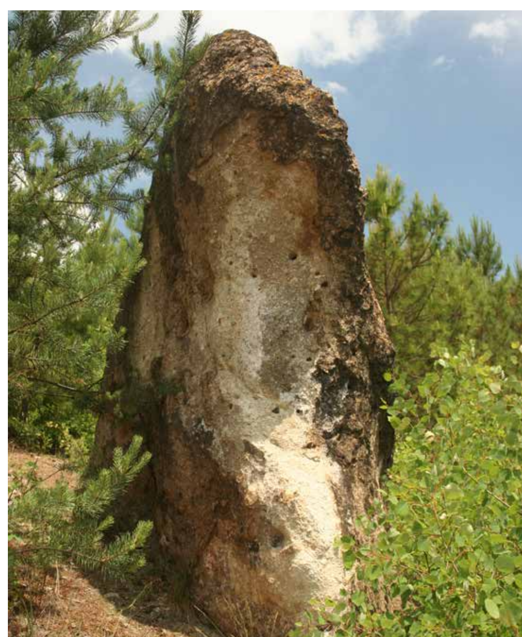
A Kőbojtár riolittufa-tornya

A település melletti Maklyán várat (másképpen: Maklány) feltehetően a Debrői Maklyán család építtette a XIII. század második felében. 1435-ben már csak mint rom szerepel az iratokban, 1509-ben pedig már csak a vár helye. A bükkaljai kőértékek szép példái a vár közelében található tufába vájt juhodály illetve a Kőbújó (Kőasszony) nevű riolittufa sziklakúp, amibe bújószerű helyiséget faragtak. Ettől délre van egy fülke nélküli magányos kúp is, amit a helyi lakosok Kőbojtárnak neveznek.