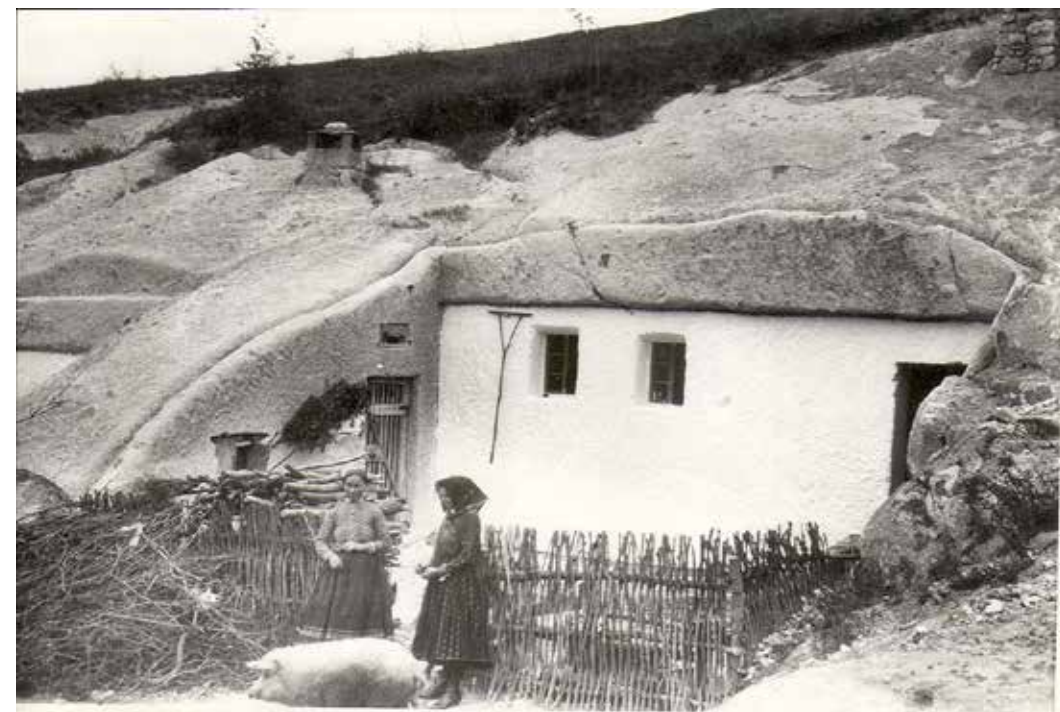
A barlanglakások régen...

A kő megmunkálásának, a kőfaragásnak, a kőzetbe mélyített lakások készítésének a kezdete a Kárpát-medencében itt, a Bükkalján nyúlik vissza a legrégibbi időkig.