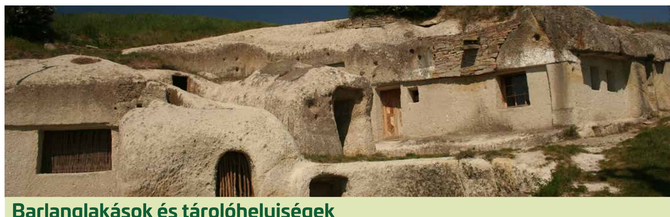
Barlanglakások és tárolóhelyiségek

sel védték, számos helyen megfigyelhető a fa vagy kő oszlopokkal alátámasztott, cseréppel fedett eresz nyoma. A módosabb gazdák később tornácos kiképzésű lakásokat vágattak maguknak. Kétszintes barlanglakásokat is találunk, főként Szomolyán.