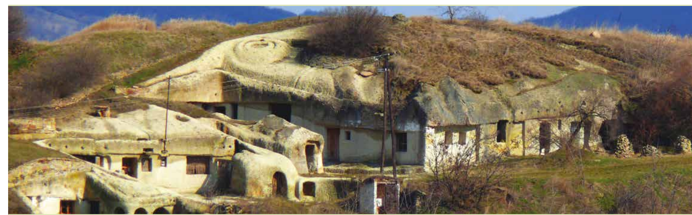
A Pocem látképe

Bejelentkezés, információ: +36-31/7812855, +36-30/376-8262