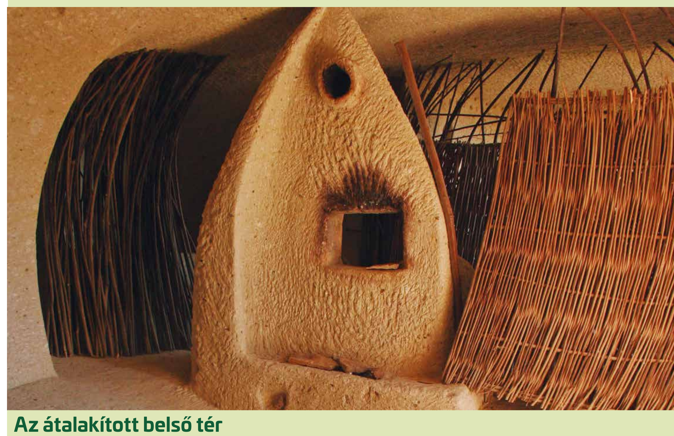
Az átalakított belső tér

szerszámosműhely) használták azokat, majd lassan enyészetnek indultak, nemcsak Noszvajon, de a környéken mindenhol. A kőkultúra nyomai, emlékei korszerűtlenné váltak. A Farkaskő Noszvaji Barlang Művésztelep Egyesület azonban tevékenységével megváltoztatta ezt a helyzetet.