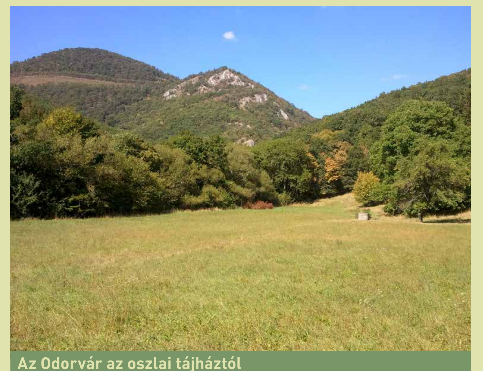
Az Odorvár az oszlai tájházról