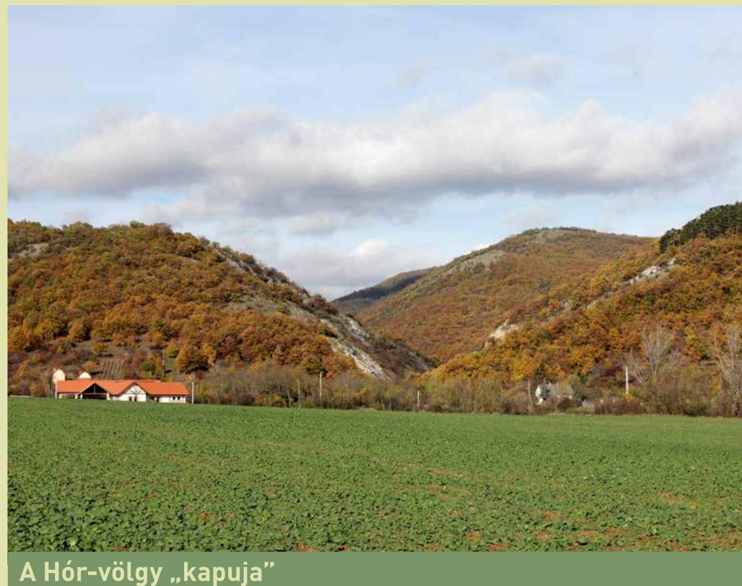
A Hór-völgy „kapuja”

A Hór-völgy D-i szakaszán található oszlai rét szélén, fenyők árnyékában egy fehérre meszelt falú, tornácos épület áll: az oszlai tájház . A házat még a 19. század végén építették a cserépfalui Coburgok erdőőri lakásnak. Az elhagyatott épületet a Bükki Nemzeti Park Igazgatóság újíttatta fel és rendezett be benne állandó kiállítást, amit 1981 óta tekinthet meg a nagyközönség. Az épületben öt helyiség található. A kamra, a pitvar és a két lakószoba ad otthont a Bogácson, Bükkzsércen, Szomolyán és Cserépfaluban összegyűjtött néprajzi anyagnak. A kemencés szobában a Cserépfaluból származó egyszerű, polgári bútorokat, míg a legbelső, „tisztaszobában” a katolikus Bogács és