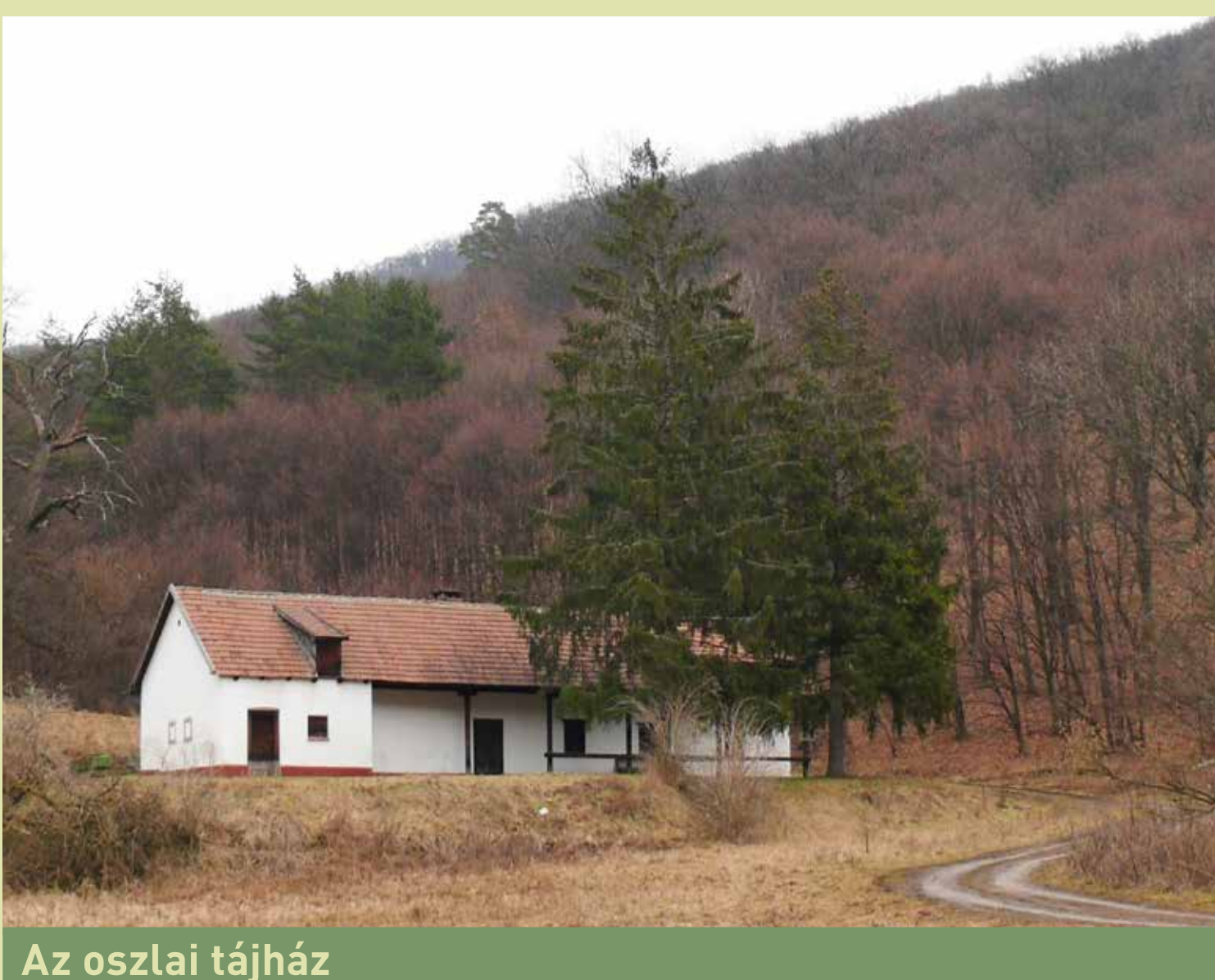
Az oszlai tájház

A Dél-Bükk legjelentősebb őskőkori lelőhelye a Suba-lyuk , mely a hegység déli peremén, a szorossá szűkülő Hór-völgy oldalában helyezkedik el. Az 1932. február 8-án Dancza János által megkezdett és az április 27-én előkerült antropológiai leletek fellelése után május 9-től Kadič Ottokár által szeptember 30-ig folytatott ásás. A lelőhely kiemelt jelentőségét a benne talált antropológiai leleteknek és a pleisztocén utolsó szakaszát felölelő, szinte teljes rétegsornak köszönheti. A 11. rétegből került elő a barlang nevezetessége, az antropológiai lelet együttes. Az új kutatási eredmények szerint a 25-35 éves nő és a 3-4 éves gyermek a klasszikus neandervölgyi emberek közé tartozott. A