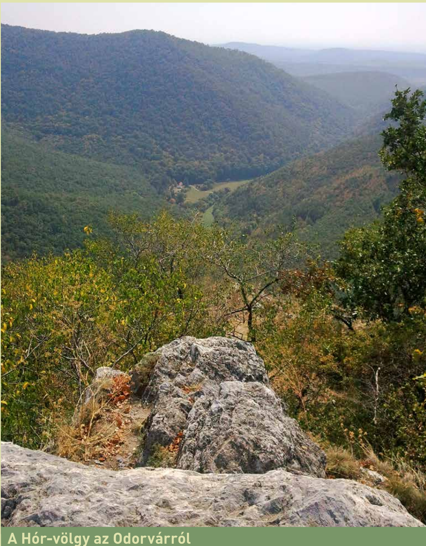
A Hór-völgy az Odorvarról

A völgy kijárata közelében lévő nagy mészkőbányák környékén a völgytalpon több helyen fellelhetők még az egykori mészégetés nyomát őrző, 5-8 m átmérőjű gödrök.