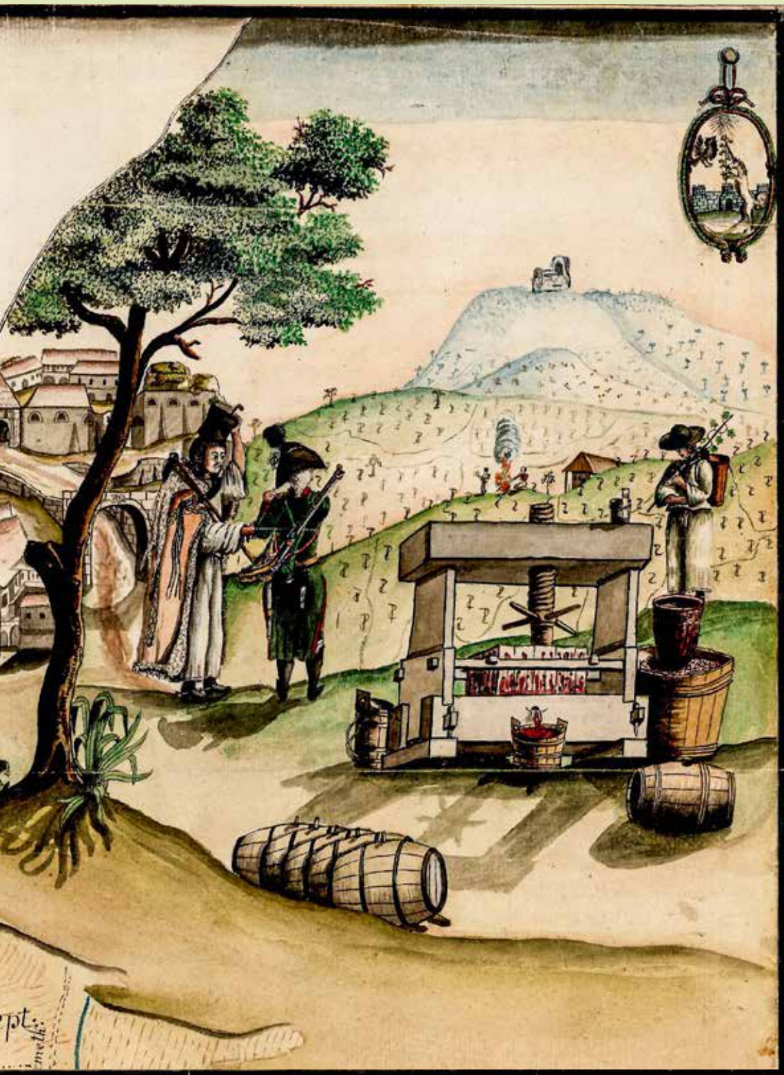
Eger látképe a Nagy-Eged hegygel Vicentius Neuwirth Egerről készült térképén 1800-ból.

A Nagy-Eged hegy feltehetően a Szent István által ide telepített vallonoktól kapta nevét, akik elsőként telepítettek szőlőt a hegyre, és magukkal hozták nyugatról Szent Egyednek – a középkor népszerű szentjének – tiszteletét, aki szülei halála után örökségét szétosztotta a szegények között.