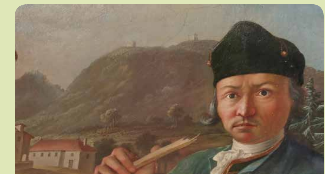
Feltehetően a Nagy-Eged hegy ábrázolása az egri Kisrépresti palota egyik termének falán.

Sok elnevezés őrizi az „Egedi remeték” emlékét. Ilyen a hegy tetején nyúló 7 m hosszú Remete-barlang, vagy a régi térképeken – a hegy északi oldalában – jelzett Remete-forrás is, „melynek vize soha ki nem fog, mert a remete imádsága tartja”. A forrást sajnos ma már hiába keressük, mivel a szárazabb klíma miatt víz itt már nem fakad.