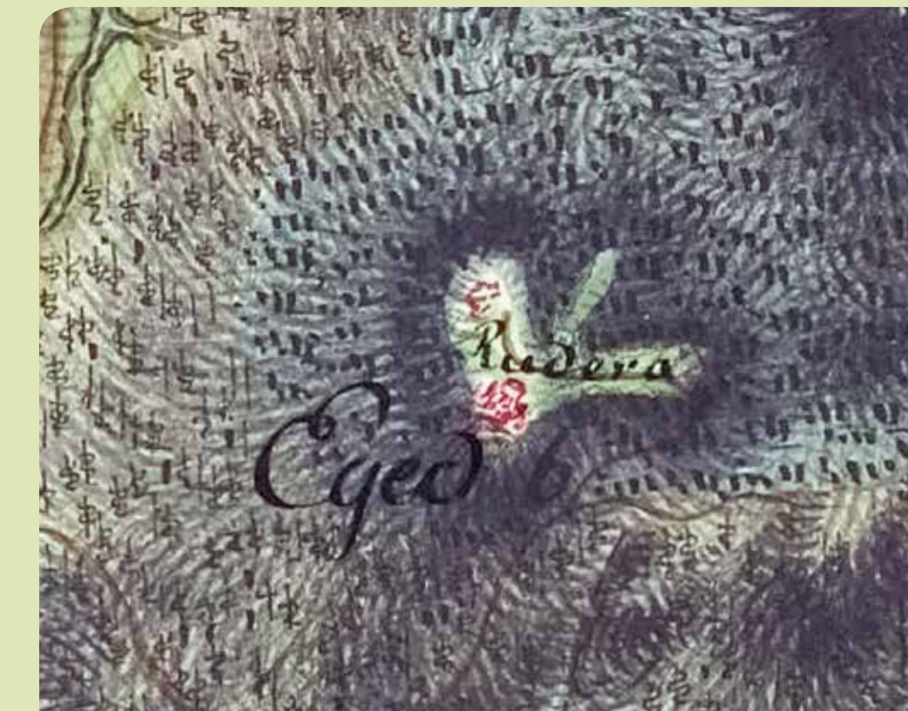
A kápolna körvonala és „Rudera” felirat (vagyis épület rom) szerepel a Nagy-Eged hegy tetején Magyarország Első Katonai Felmérésén (1782-1785).

Az ma már szinte biztos a levéltári dokumentumok és a korabeli ábrázolások alapján, hogy az 1700-as években kápolna állt a Nagy-Eged hegy tetején, azonban arról, hogy mikor épült és mikor lett rommá, szinte semmilyen adat nem maradt fenn.