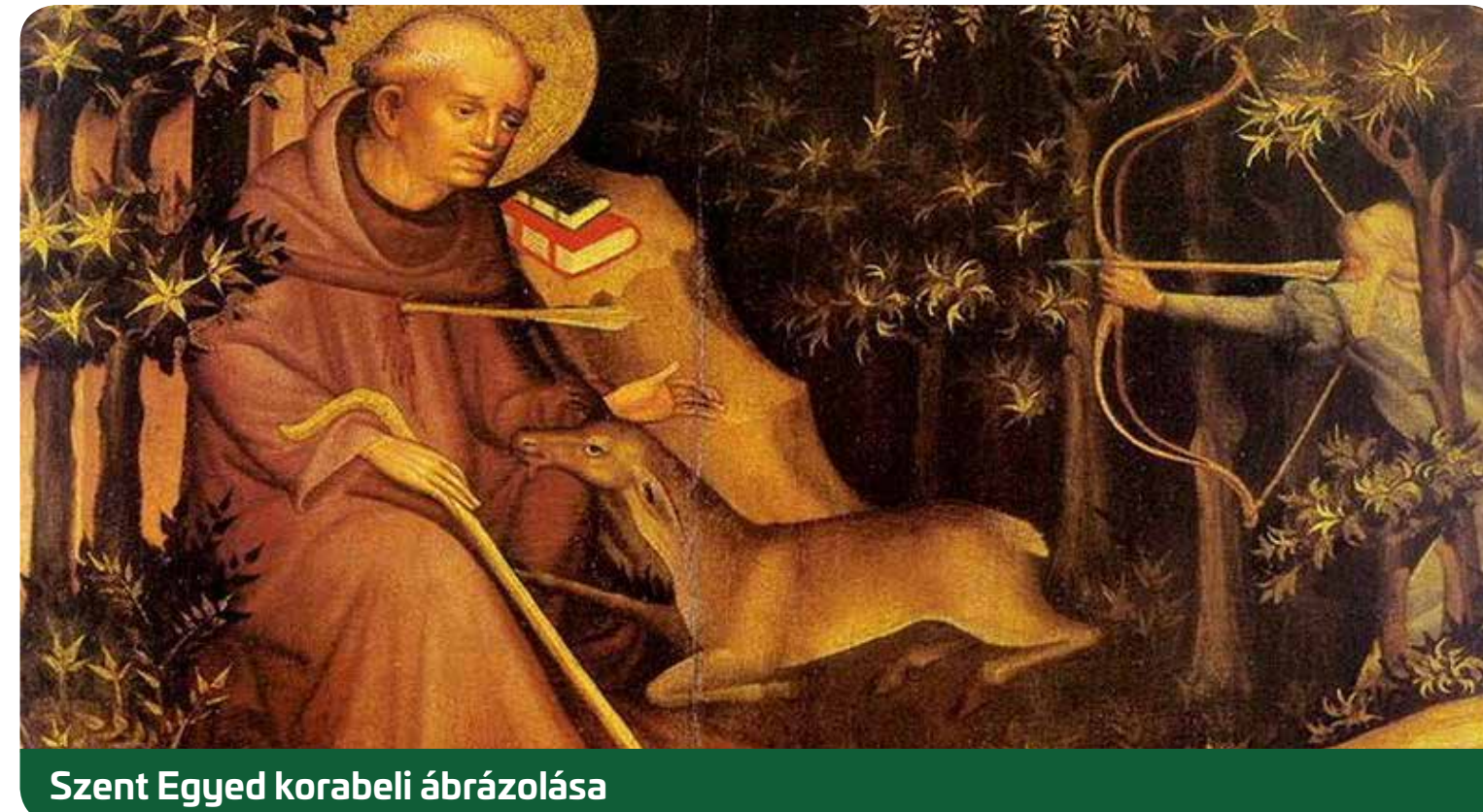
Szent Egyed korabeli ábrázolása

A Nagy-Eged hegy feltehetően a Szent István által ide telepített vallonoktól kapta nevét, akik elsőként telepítettek szőlőt a hegyre, és magukkal hozták nyugatról Szent Egyednek – a középkor népszerű szentjének – tiszteletét, aki szülei halála után örökségét szétosztotta a szegények között.