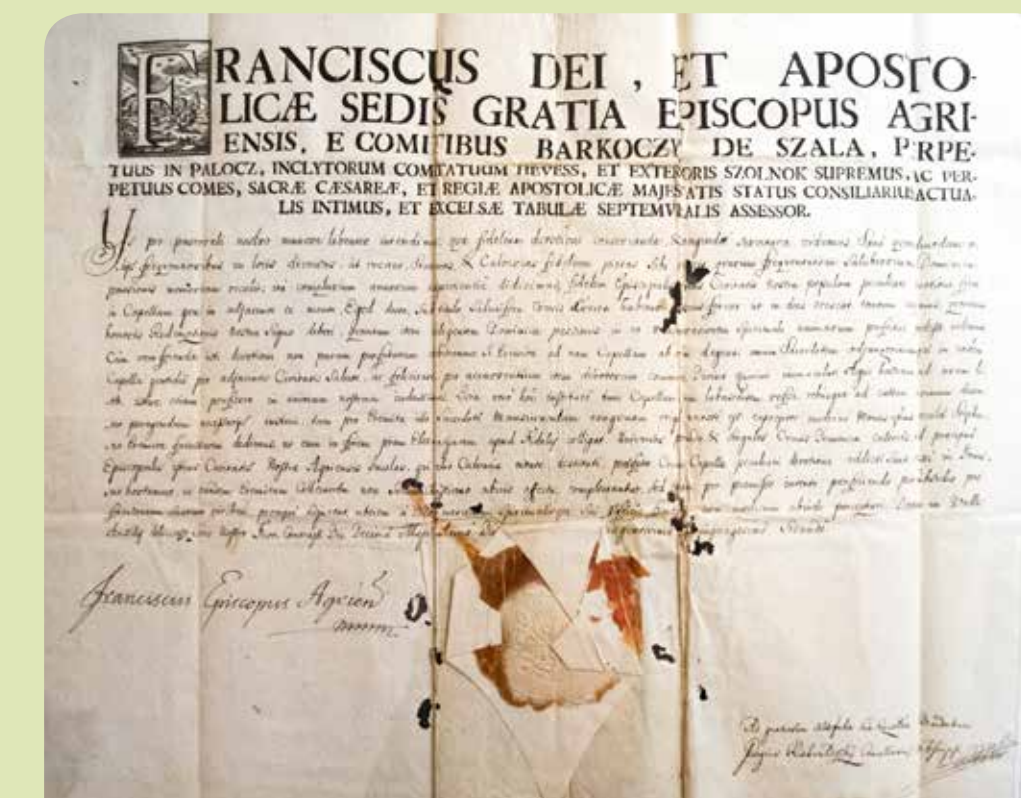
Barkóczy Ferenc egri püspök 1752. május 10-én írt latin nyelvű támogató levele.

A kápolna legkorábbi írásos említése Barkóczy Ferenc egri püspök 1752. május 10-én írt latin nyelvű támogató leveléből származik, amely egy határozat a kápolna újjáépítésére. „...az elmúlt évek során Püspöki Városunk hívó keresztény lakosai között is azt tapasztaltuk, hogy valamiféle megkülönböztetett buzgósággal viselkednek azon kápolna iránt, amely üdvösségünk címerének, a Szent Keresztnak a tiszteletére áll a szomszéd Eged nevű hegyen... az omladozásnak induló kápolnát szükséges megújítani...”